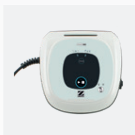
Boîtier de commande