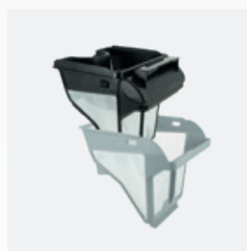
Bac filtrant Filtre double niveau : 150/60 µ