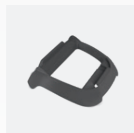
Socle pour boîtier de commande