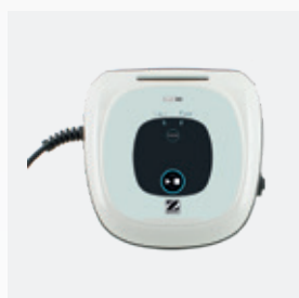
Boîtier de commande