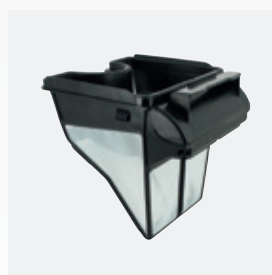
Bac filtrant Filtre simple 100 µ