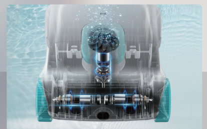
Système à trois moteurs