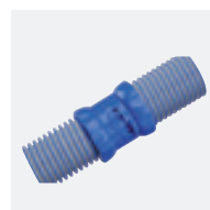
Tuyaux Twist Lock