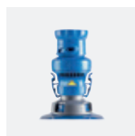
Régulateur de débit (robot)