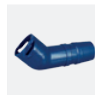
Coude 45° allongé rotatif