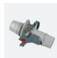
Vanne de réglage automatique de débit (skimmer)