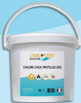
Chlore choc (5kg)

Continuer votre traitement permanent et adapter votre temps de filtration journalier en fonction de la température de votre eau. (température de l'eau / 2, exemple : eau à 22°C / 2 = 11h de filtration par jour).