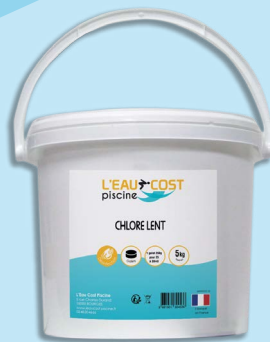
Chlore lent (5kg)