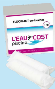
Floculant cartouches (1kg)