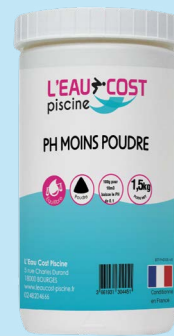
PH moins (1,5kg)